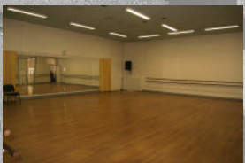
Studios de Danse